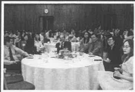
(Lễ kỷ niệm ngày ITEC năm 2023)

The Indian Technical and Economic Cooperation (ITEC) Programme is a Government of India training programme to share experiences and learnings from India's economic and technological development with international partners. India's ITEC partnership with Vietnam dates back to the 1970s. Over 200 participants from Vietnam attend ITEC courses for human resource development in fields such as management, entrepreneurship, financing, ICT and so on, aimed at advancing national development and modernization.