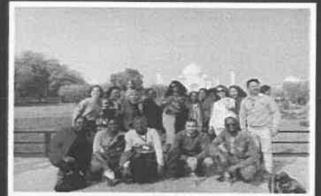
(Học viên ITEC Việt Nam chụp ảnh trước lăng mộ Taj Mahal nổi tiếng)

Scan QR code to access the Embassy's Facebook Quét mã QR để truy cập trang Facebook Đại sứ quán