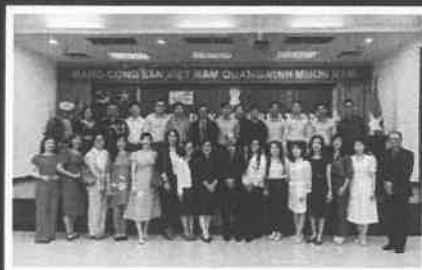
(Kỷ niệm gặp gỡ cựu học viên ITEC 2023)

Những khóa đào tạo ngắn hạn này dành cho cán bộ, nhân viên nhà nước và tư nhân, các trường đại học, các phòng thương mại và công nghiệp, v.v, trong độ tuổi từ 25-45, có kinh nghiệm làm việc phù hợp, có trình độ tiếng Anh và chưa từng theo học khóa đào tạo nào do Chính phủ Ấn Độ tài trợ. Học bổng gồm vé máy bay quốc tế khứ hồi, lệ phí visa, học phí, tài liệu học tập, chỗ ở, trợ cấp sinh hoạt phí hàng ngày và các chuyến tham quan thực tế trong thời gian khóa học.