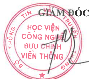
PGS.TS. Đặng Hoài Bắc

2. Trong quá trình thực hiện nếu có vấn đề phát sinh, các đơn vị, cá nhân gửi đề xuất về Phòng QLKH&HTQT để phòng trình Lãnh đạo Học viện xem xét sửa đổi, bổ sung cho phù hợp thực tiễn./.