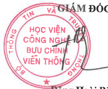
Đặng Hoài Bắc